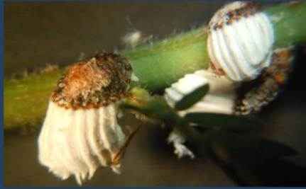
An Illustrated Overview of Species with special reference to Homopteran Pests.